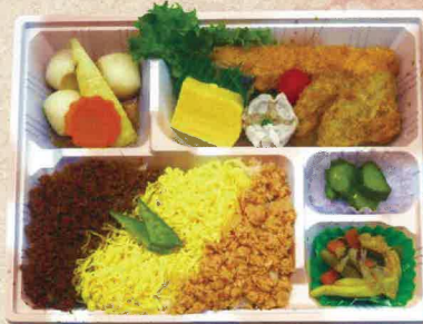
B-5 つばさ 1,000円

鮭/チキン/玉子焼き/しそ巻/練り物/カニちらしご飯/ 天ぷら/青物/フルーツ/甘味/漬物/その他