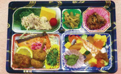
B-6 あおば 1,200円

煮物/海老フライ/シューマイ/ヒレかつ/玉子焼き/ 三色ご飯(牛そぼろ・玉子・鮭フレーク)/漬物/その他