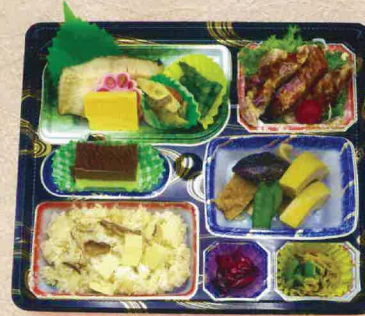
B-3 はやて 1,500円