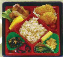
B-8 あさひ 600円

チキン/フルーツ/カキフライ/ ひじき/青物/玉子焼き/ 竹の子ご飯/漬物/その他