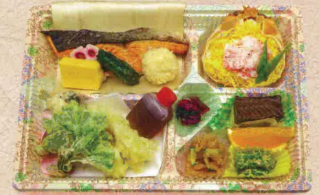
B-4 みずほ 1,500円

鮭/チキン/玉子焼き/しそ巻/練り物/カニちらしご飯/ 天ぷら/青物/フルーツ/甘味/漬物/その他