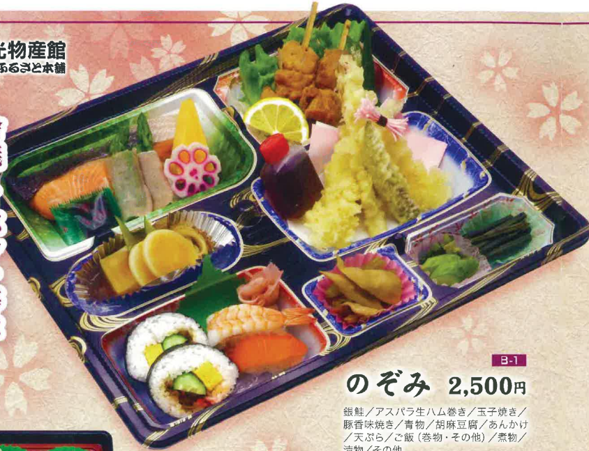
B-1 のぞみ 2,500円

銀鮭/アスパラ生ハム巻き/玉子焼き/ 豚香味焼き/青物/胡麻豆腐/あんかけ/ 天ぷら/ご飯(巻物・その他)/煮物/ 漬物/その他