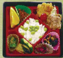
B-9 いなほ 600円

チキン/フルーツ/カキフライ/ ひじき/青物/玉子焼き/ 竹の子ご飯/漬物/その他