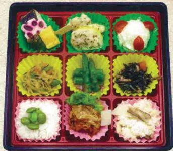
B-2 こまち 1,000円

銀鮭/アスパラ生ハム巻き/玉子焼き/ 豚香味焼き/青物/胡麻豆腐/あんかけ/ 天ぷら/ご飯(巻物・その他)/煮物/ 漬物/その他